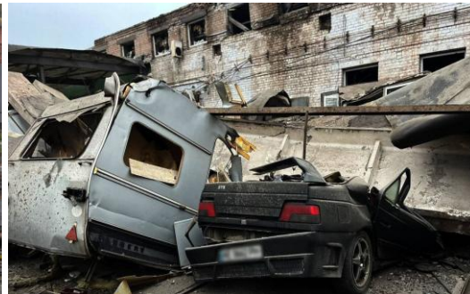
第聶伯羅彼得羅夫斯克州