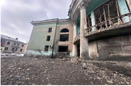
Oblast de Zaporijjia