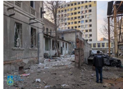
Oblast de Tcherkassy