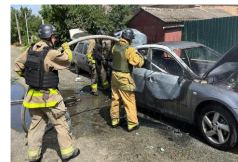
La región de Jersón