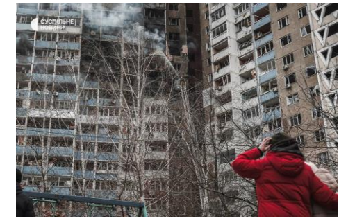
Zaporizhzhia and oblast