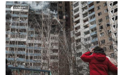
Zaporizhzhia and oblast