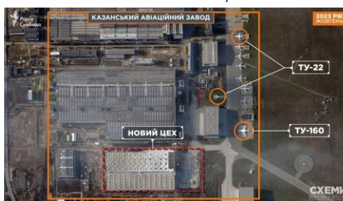
Planta de Aviación de Kazán, Planta de Aviación de Irkutsk, Planta de Construcción de Maquinaria de Dubna, Kronstadt y Planta de Aviación Civil de los Urales.