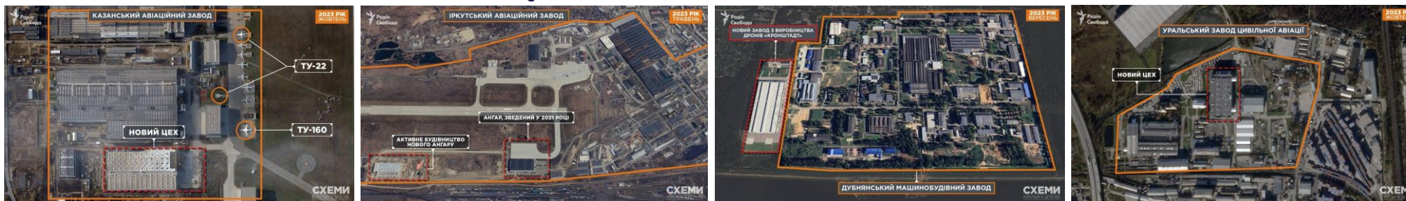
Kazan Aviation Plant, Irkutsk Aviation Plant, Dubna Machine-Building Plant, Kronstadt, and Ural Civil Aviation Plant