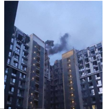
The week of shelling 24-30.07.2023