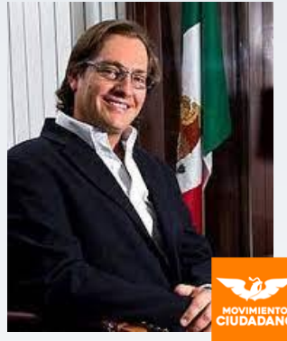
Salomón Chertorivski Woldenberg

Diputado y economista. Mexicano con ascendencia ucraniana.