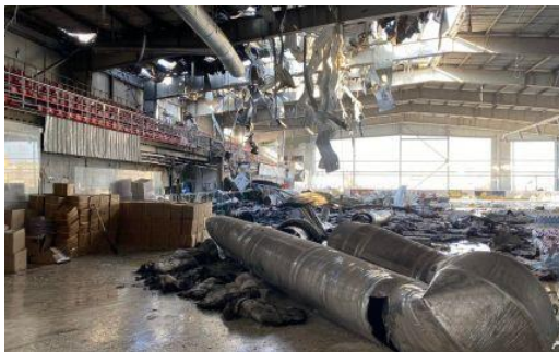
Druzhkivka, Donetsk oblast