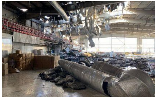
Druzhkivka, Donetsk oblast