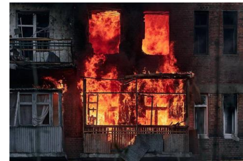
Bakhmut, Donetsk region