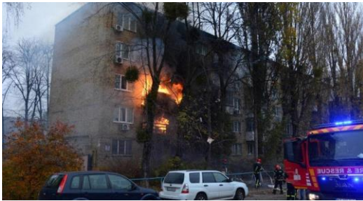
Region Kyjiw, 15.11