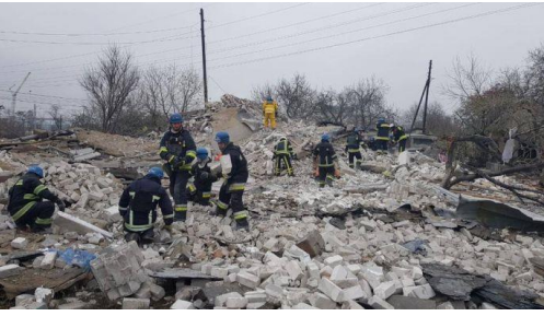
Vilniansk, Zaporizhzhia region.