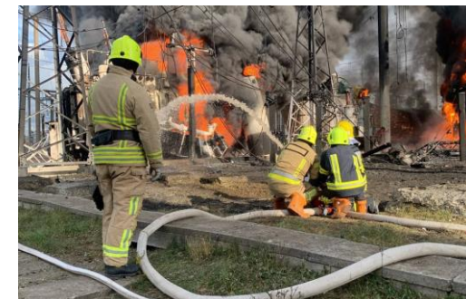
Consequences of attack on power infrastructure in Rivne (left) and Zhytomyr (right)